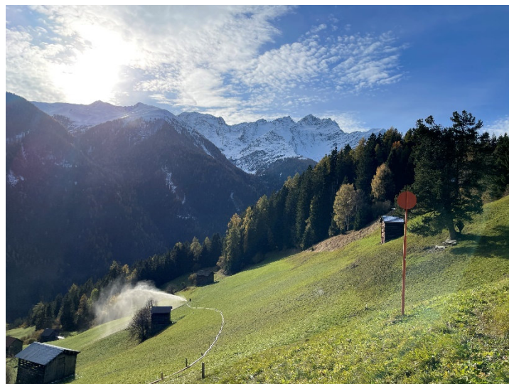
Biomasse-Ausbringung Egger Weiher, KLAR! Arlberg Stanzertal

Mit Unterstützung von Bund, Land und Europäischer Union