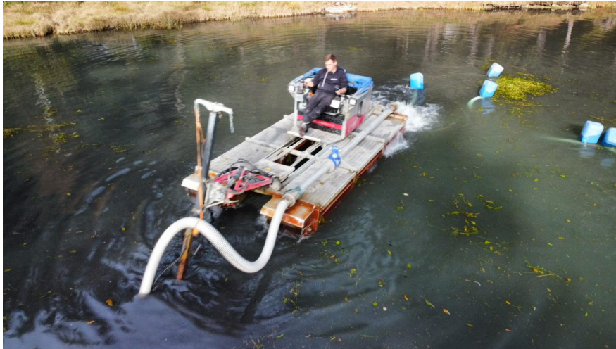
Saugbagger, Thomas Siegl_ Erbau Siegl