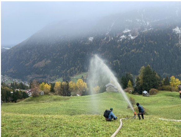
Ausbringung Biomasse_KLAR Arlberg Stanzertal, Gasser-Mark